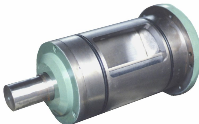
■ Роторный насо