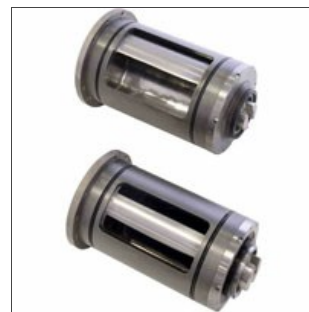
Примеры роторных насосов