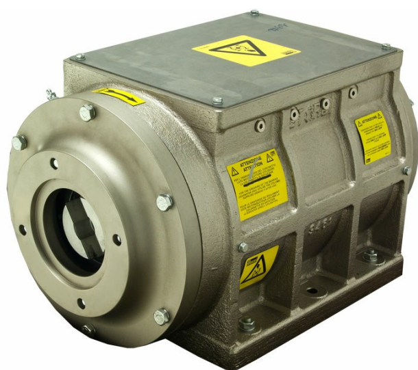
■ Роторный насо