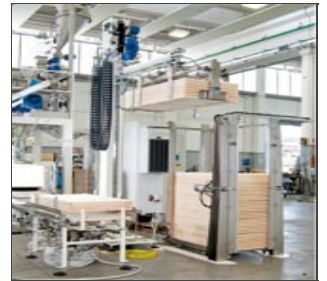
Robo XI: роботизированная система в конце линии