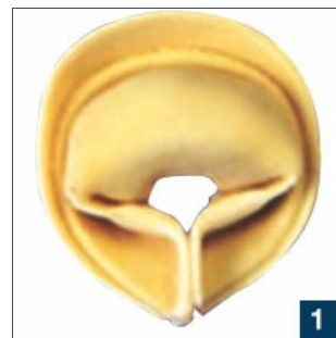
Капелетто со сжатыми концами теста