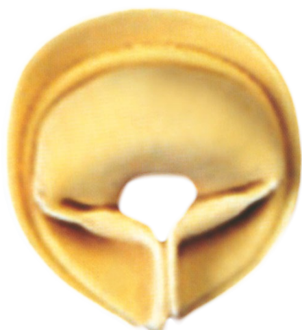
■ Капеллетто со сжатыми концами теста