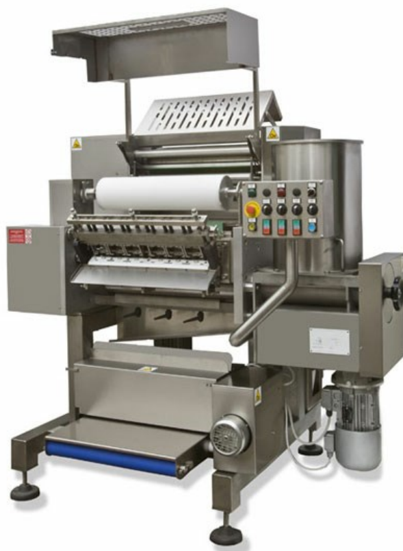
■ Аппарат для изготовления равиоли из одинарного слоя теста R 540 C