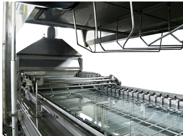
■ Фрагмент модуля варки со штоками