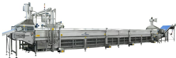
■ Модуль варки со штоками ССТ