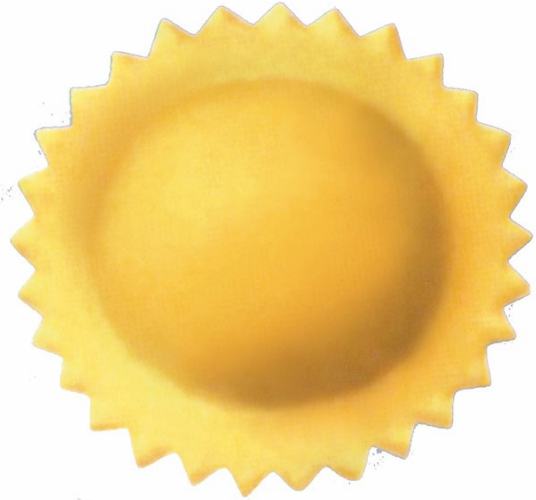
■ Круглый raviolo из двойного листа