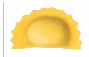
Медзалуна из двойного слоя теста

Устройство резки и/или сбора обрезков; независимая электронная регулировка скорости подачи листа теста