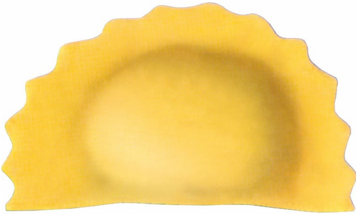
■ Медзалуна из двойного слоя теста